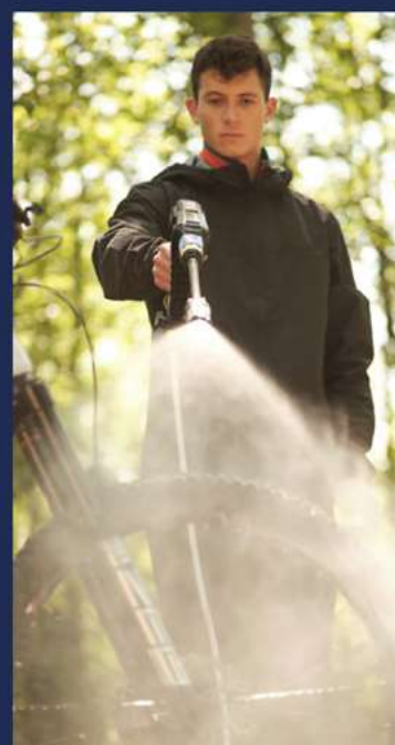
IDROPULTRICE 160 BAR Michelin